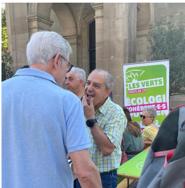
20 juillet, piétonisation temporaire et occupation positive de la place du Petit-Saconnex.