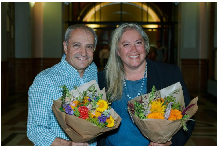
AG du 18 juin 2024.