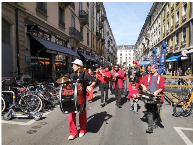
14 septembre, « jour de fête » à la rue de Fribourg.