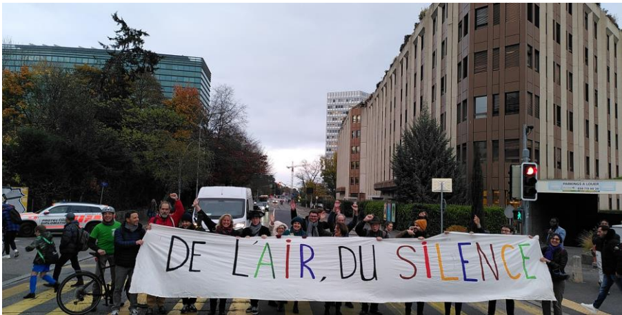
13 novembre, « De l'air, du silence ! » à l'avenue Giuseppe-Motta