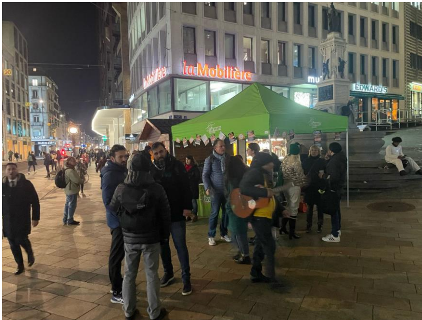
31 janvier, fondue Verte et tractages à Bel-Air.