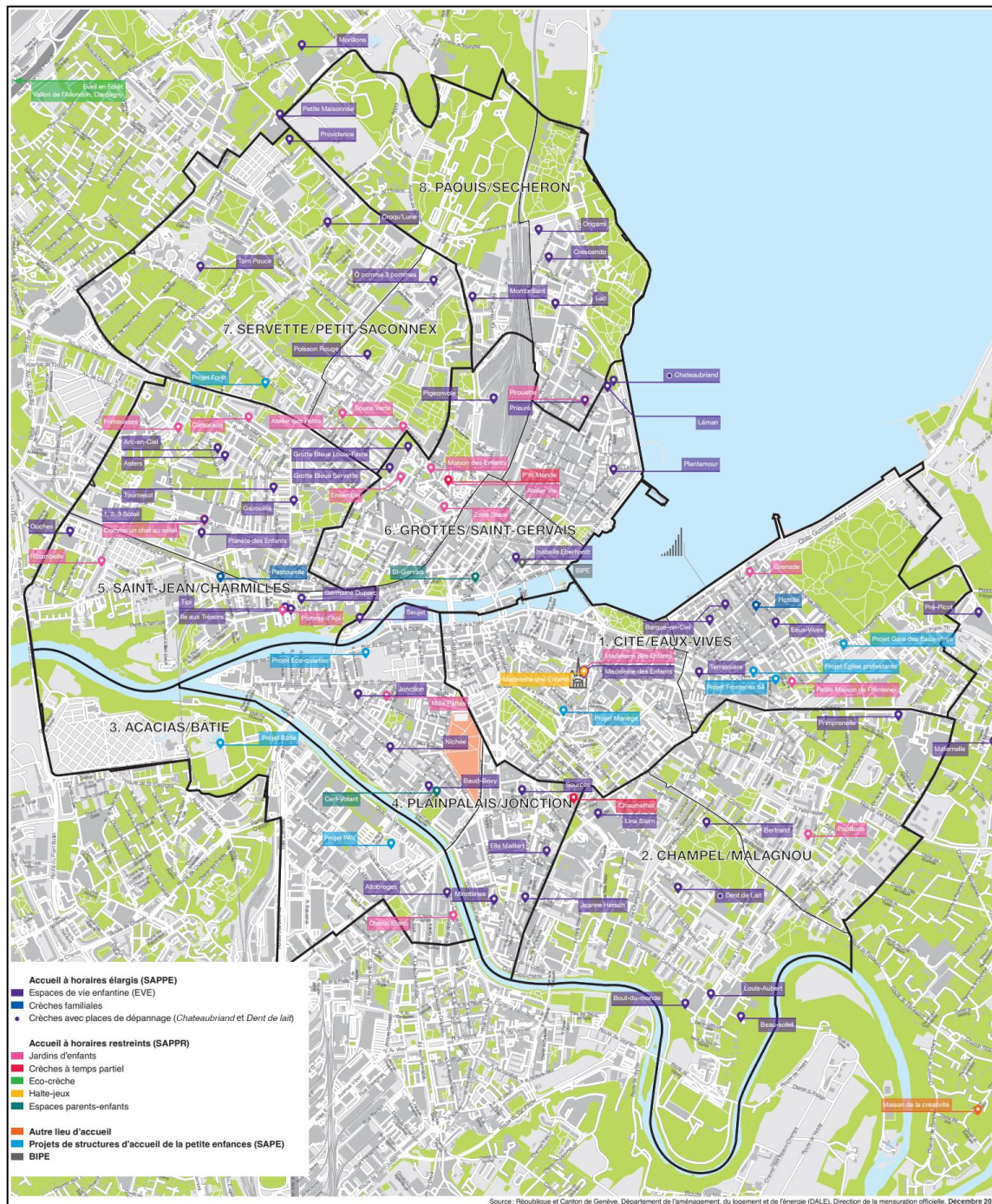
Figure 1 : Localisation des SAPE en Ville de Genève